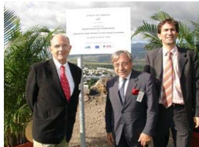
Route des tamarins