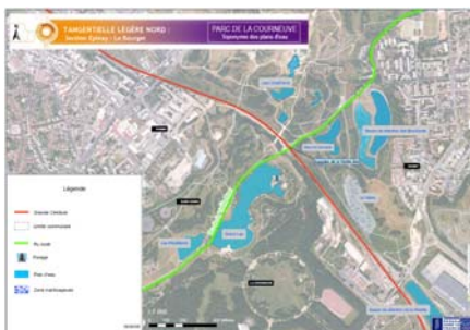
Parc de la Courneuve